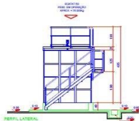
PERFIL LATERAL ESCALA 1:50