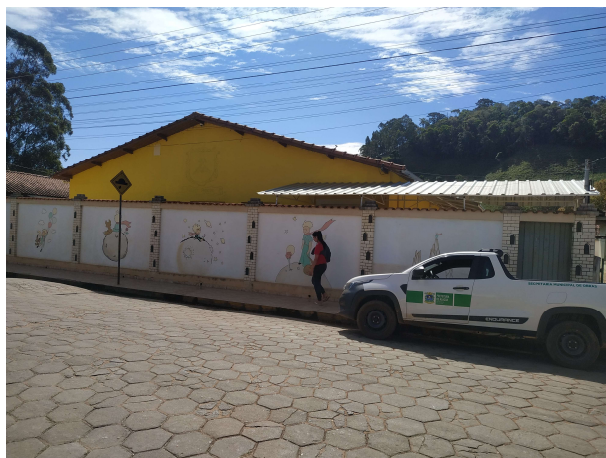
Vista da fachada frontal