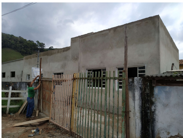
Vista fechamento atual do acesso lateral

A intervenção proposta compreende a implantação de acesso lateral ao prédio, cobertura de espaços destinados a lavanderia e área de serviços, adequação do sanitário infantil para atendimento das 02 salas contíguas, instalação de bebedouros e a execução de serviços complementares de colocação de calhas e condutores de descida pluvial, bem como a complementação de revestimentos de pisos e paredes externas.