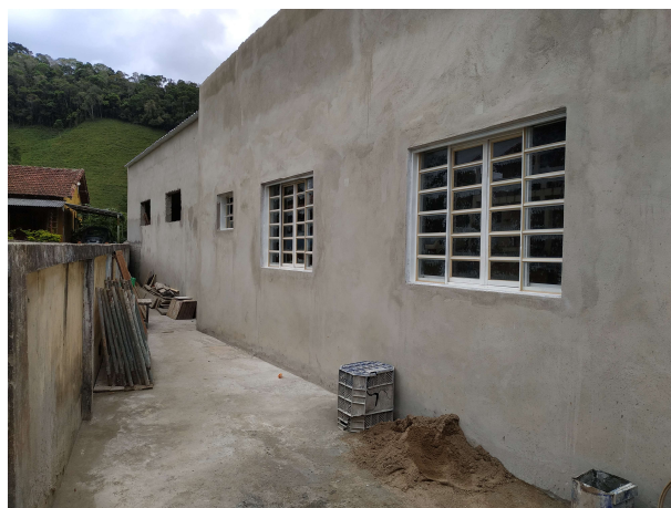
Vista área interna do acesso lateral