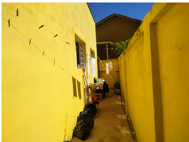
Vista atual área de serviços