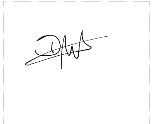
Assinatura de Deivid Macena Araújo

Pontos de autenticação: Assinatura na tela IP: 152.249.10.29 / Geolocalização: -23.685160, -46.548267 Dispositivo: Mozilla/5.0 (Linux; Android 10; K) AppleWebKit/537.36 (KHTML, like Gecko) Chrome/123.0.0.0 Mobile Safari/537.36 Data e hora: Abril 01, 2024, 17:41:25 E-mail: deivid.araujo@desosp.com Telefone: + 5511947472376 ZapSign Token: b93439d3-****-****-****-84022e237ccb