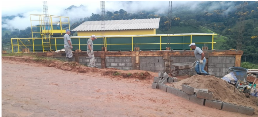
Concretagem cinta intermediária na alvenaria de contenção