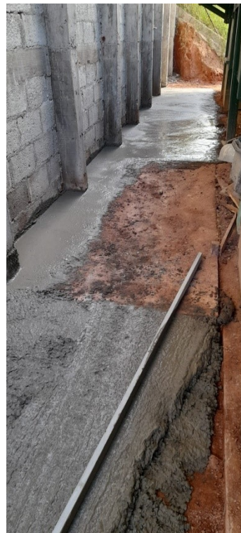
Execução lastro de concreto em pisos – calçada externa e circulação interna