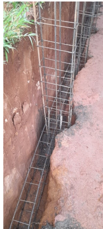
Execução de brocas e viga baldrame para fundação