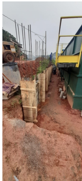
Concretagem de pilares e cintas intermediárias