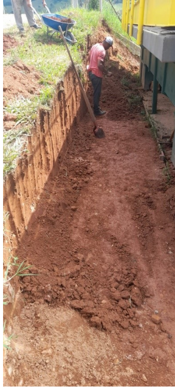
Escavação a céu aberto

RELATÓRIO FOTOGRÁFICO – 1ª MEDIÇÃO – 22/04/2024 PROCESSO LICITATÓRIO: 0005/2024 - CONTRATO Nº 2024.03.06