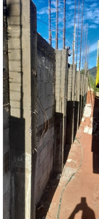
Estrutura interna alvenarias de contenção e fechamento