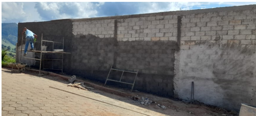
Execução revestimento externo