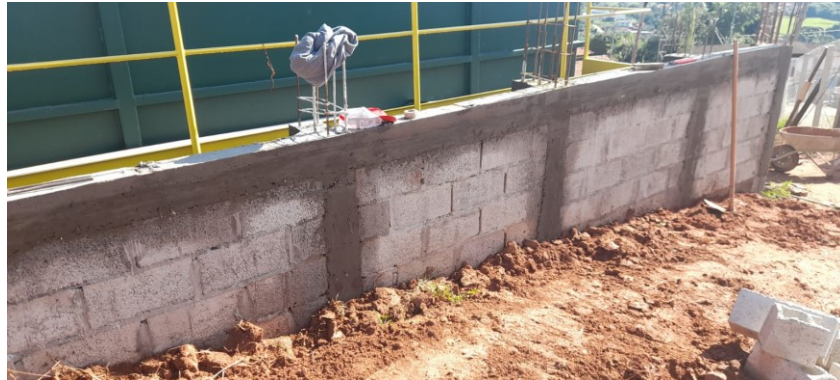
Respaldo da alvenaria de contenção