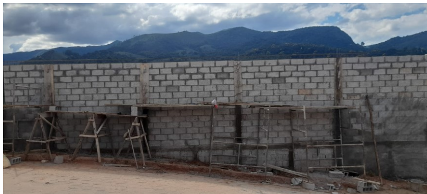
Execução da alvenaria de fechamento frontal