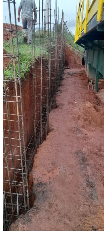
Escavação manual de valas