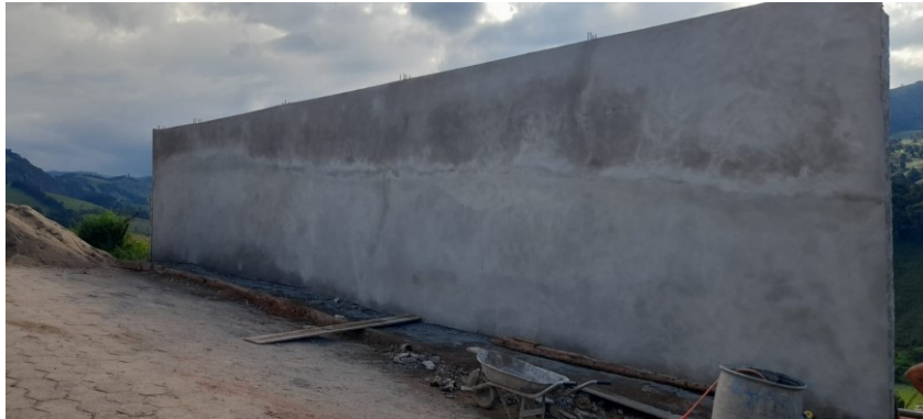
Conclusão do revestimento externo do muro