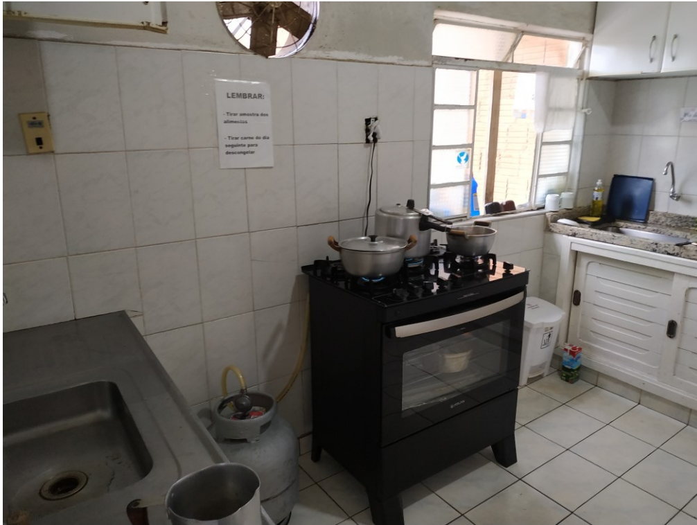
Vista interna 1 - cozinha