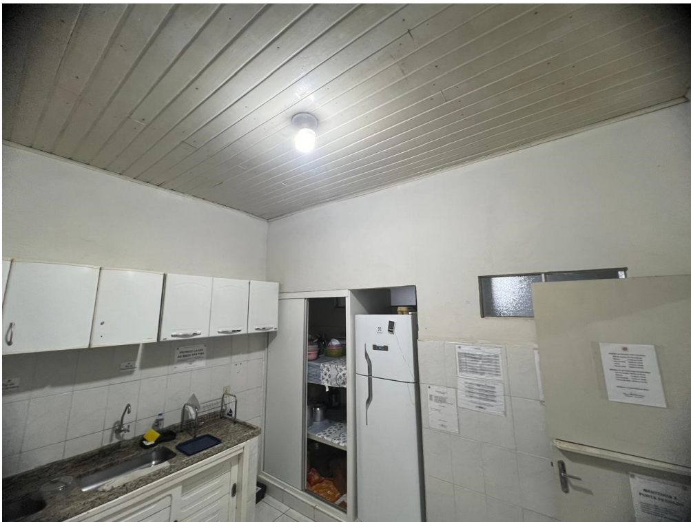
Vista interna 2 - Cozinha