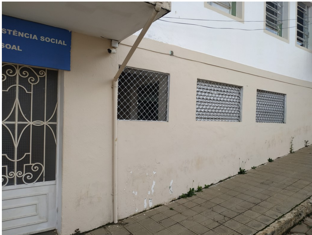
Vista externa fachada onde será implantada nova porta laboratório