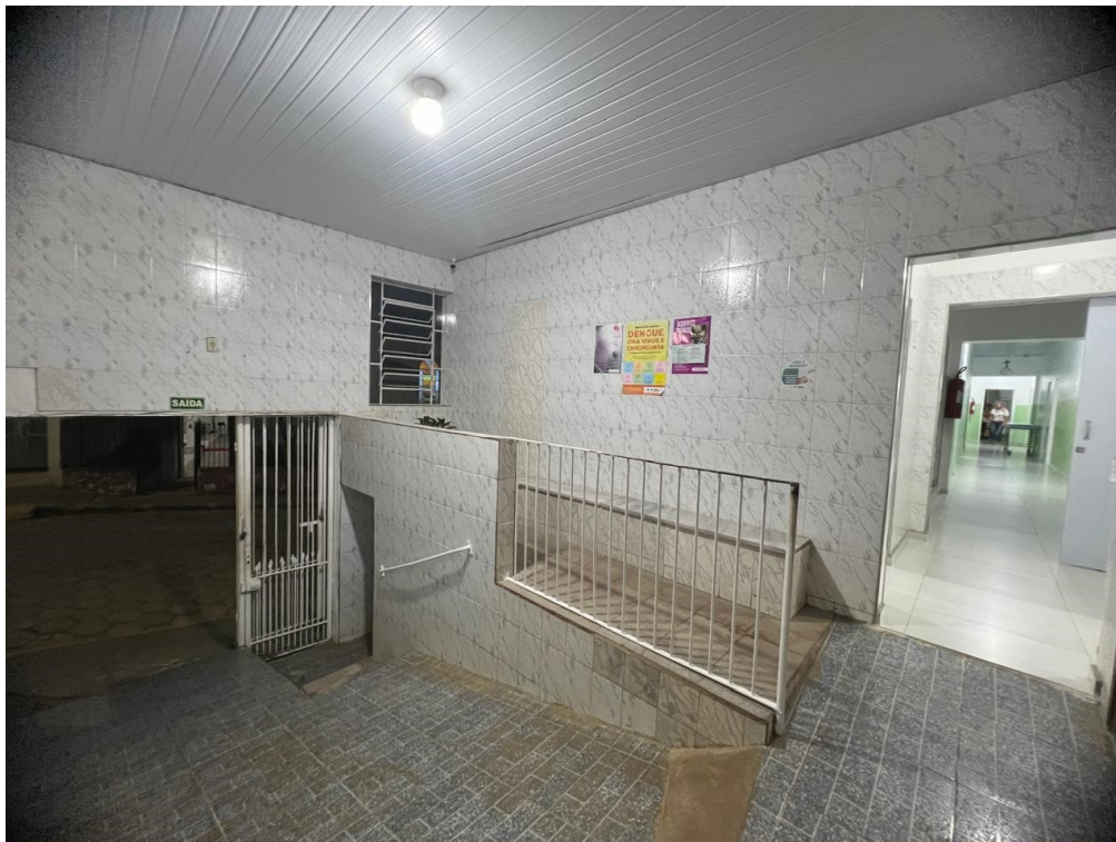
Vista 2 - Rampa de Acesso