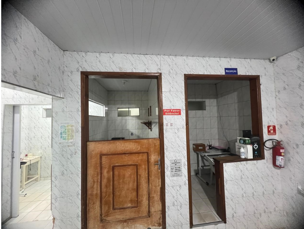
Vista externa Recepção