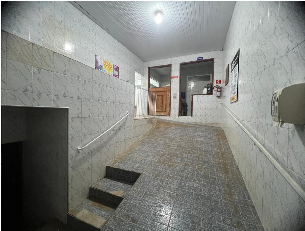
Vista 1 - rampa de Acesso